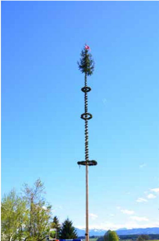
Pfaffinger Maibaum 2017

Der Jugendbewerb der Gemeinden Pfaffing, Vöcklamarkt und Fornach fand heuer am Samstag, 29. April in Pfaffing statt.