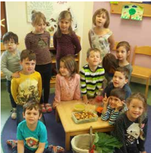
Kindergartenkinder beim Leckerbissenkorb