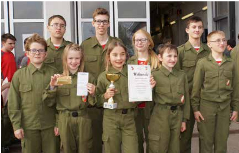
Feuerwehrjugend der FF Oberalberting