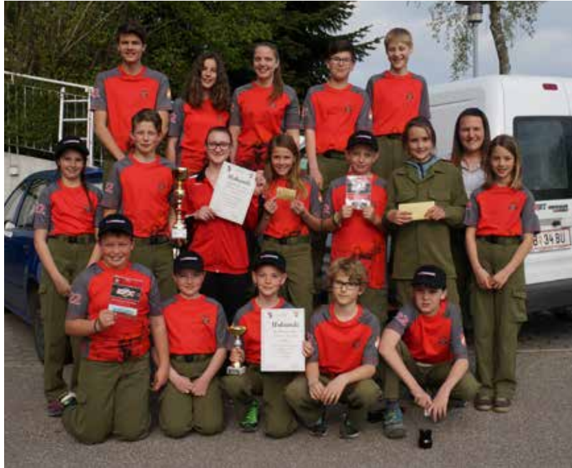
Feuerwehrjugend der FF Pfaffing.

Der Jugendbewerb der Gemeinden Pfaffing, Vöcklamarkt und Fornach fand heuer am Samstag, 29. April in Pfaffing statt.