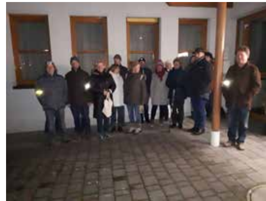
Heuer fand am Freitag, 2. Februar 2018 die alljährliche Winternachtwanderung statt.