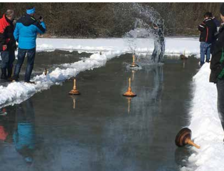
Am Sonntag, 4. März 2018 fanden die alljährlichen Eisstockmeisterschaften der Gemeinde Pfaffing statt.