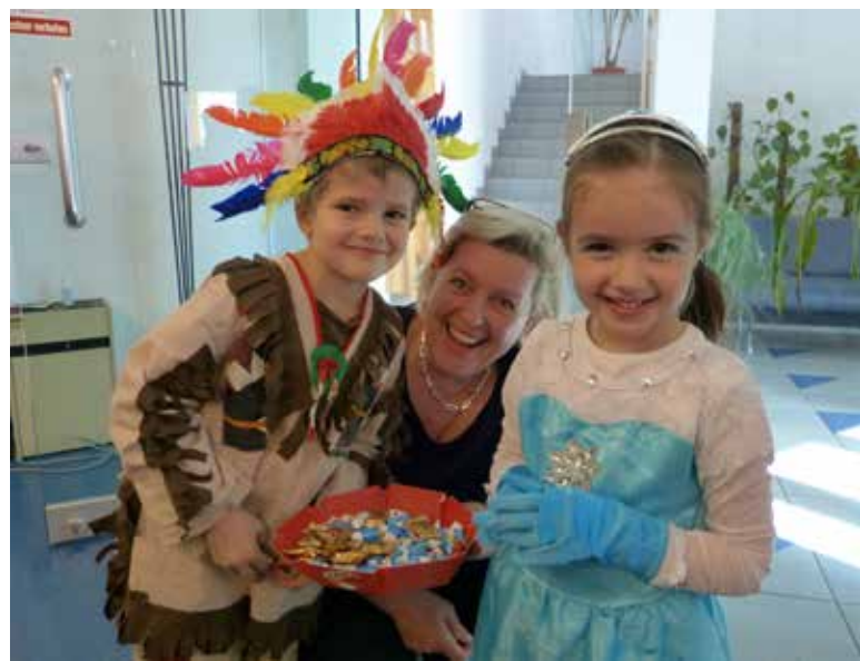
Auch heuer besuchten die Kindergartenkinder am Faschingdienstag das Gemeindeamt.