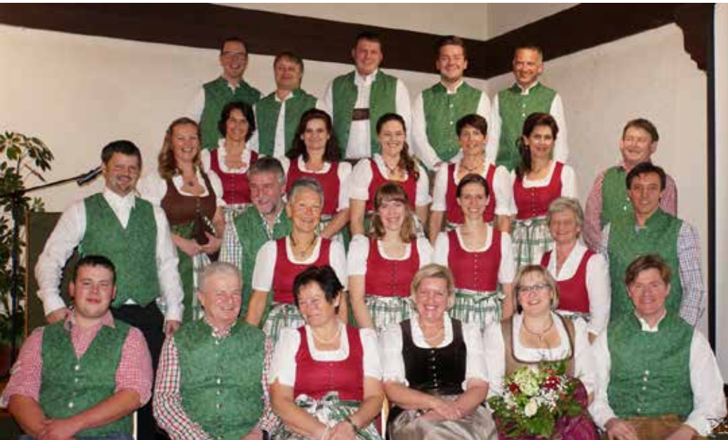
Beim heurigen Neujahrsempfang wurde die Pfaffinger Tracht vorgestellt.