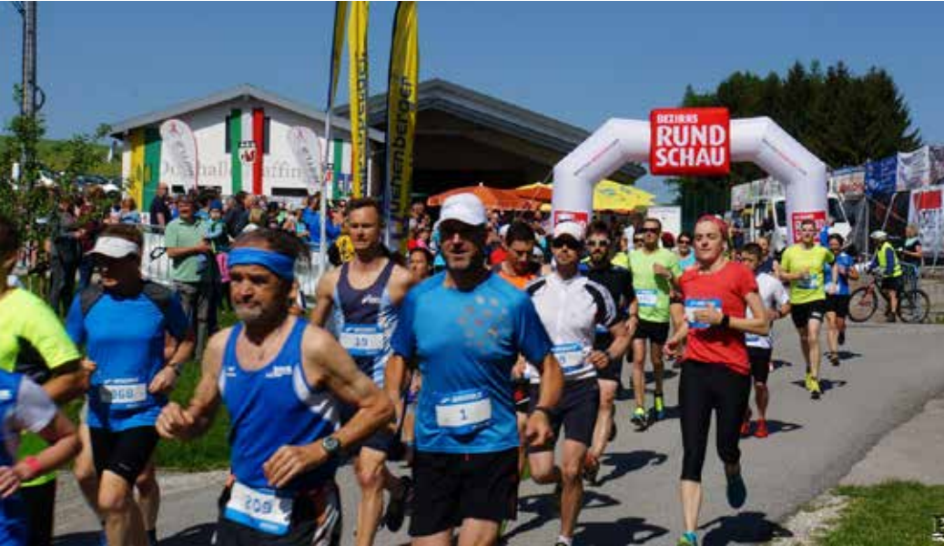
Am Sonntag, den 6. Mai 2018 fand der 15. Vöcklataler Volkslauf in Pfaffing statt.