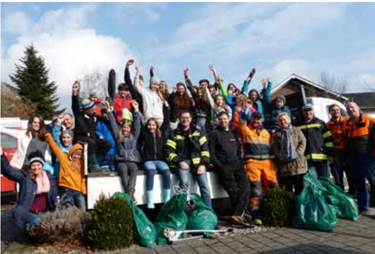
Am Dienstag, 27. März 2018 fand die alljährliche Flurreinigungsaktion der Gesunden Gemeinde Pfaffing statt.