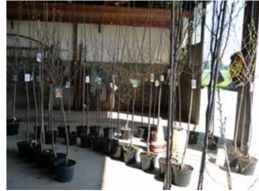
Am Freitag, 20. April 2018 wurden die Obstbäume an die neuen Besitzer verteilt.