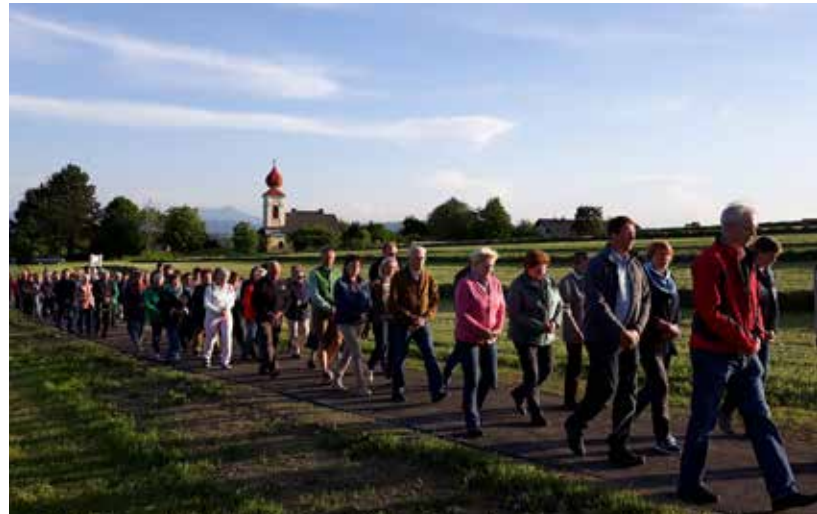
Auch heuer fand der Bittumgang in Pfaffing statt.