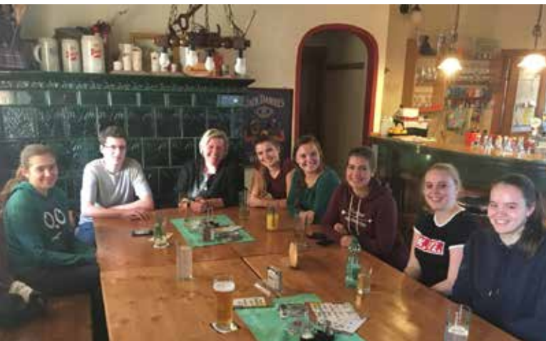
Jungbürgerfeier am Samstag, 6. Oktober 2018