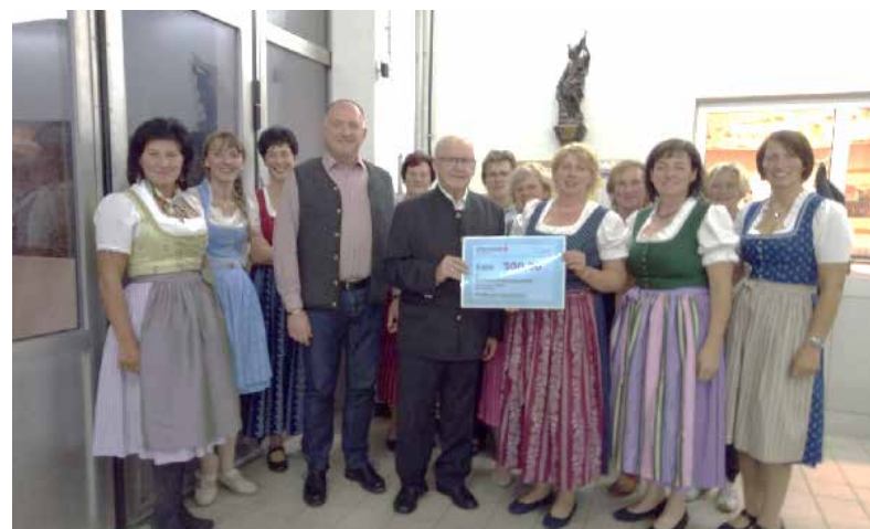
Erntedankfest der Pfaffinger Bäuerinnen am Mittwoch, 10. Oktober 2018