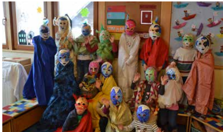
Kindergarten Pfaffing Kinderfasching unter dem Motto „Karneval in Venedig“.