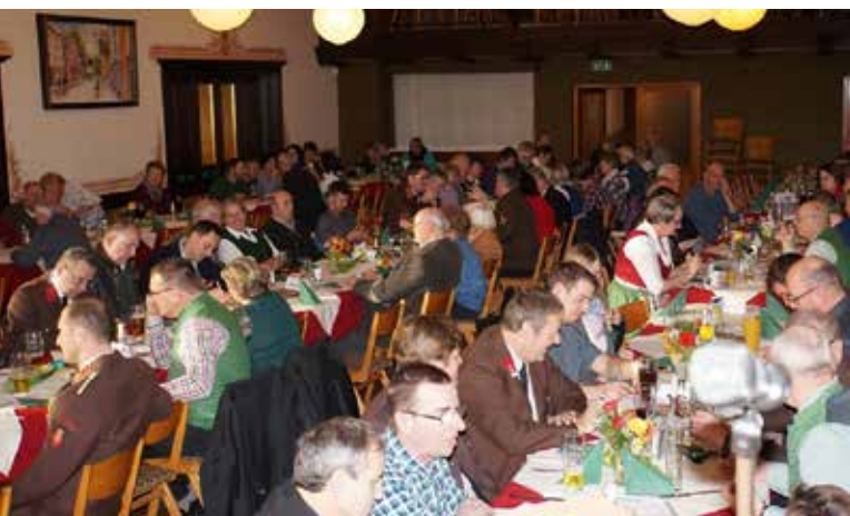
Neujahrsempfang 2019 Auch heuer waren wieder viele Pfaffingerinnen und Pfaffinger der Einladung zum Neujahrsempfang gefolgt.