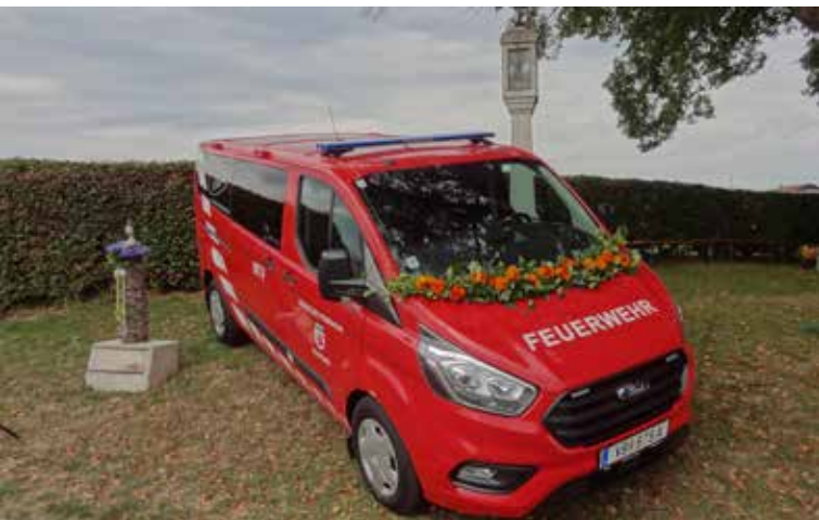
Fahrzeugsegnung FF Pfaffing, neuer MTF der FF Pfaffing