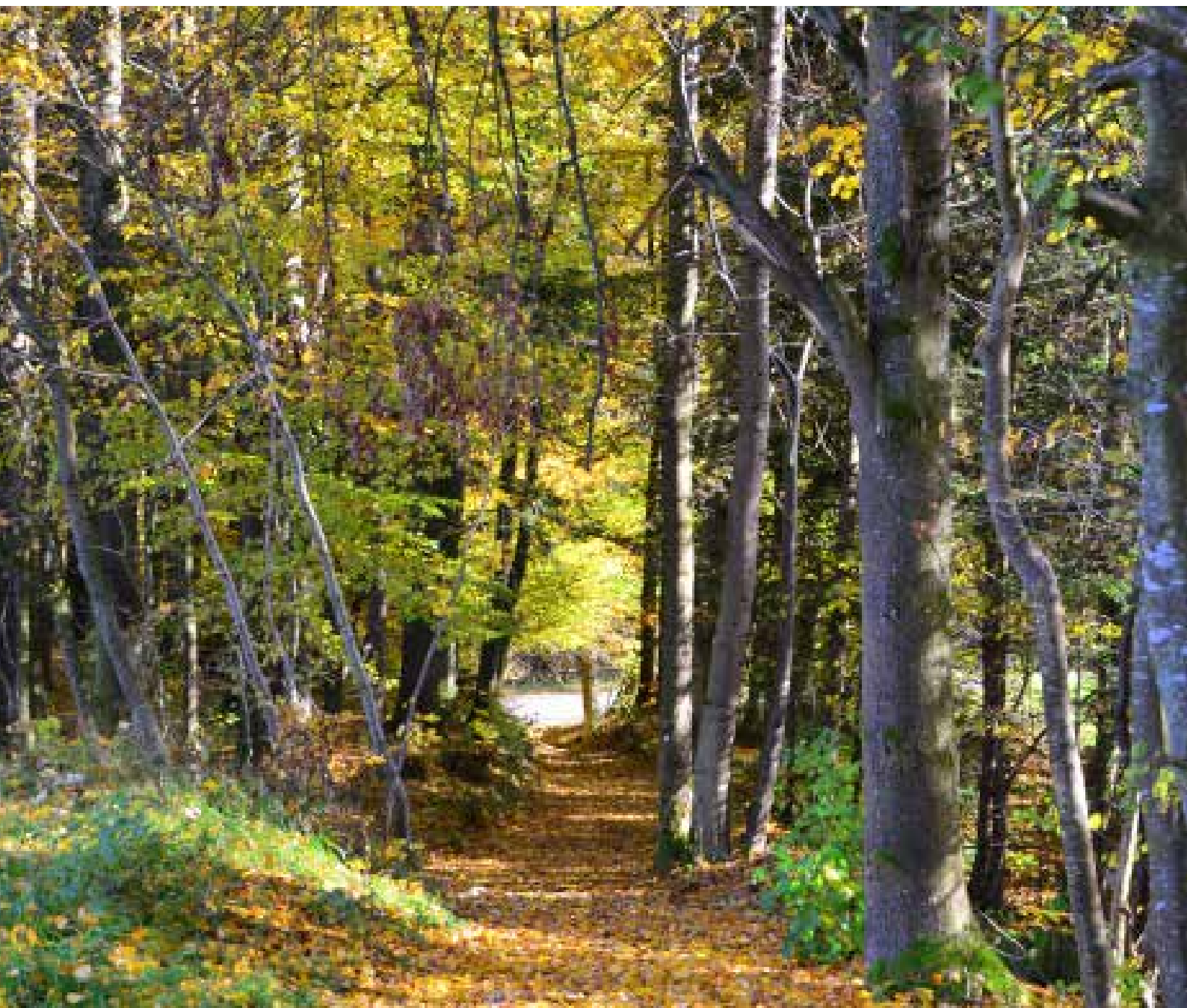
Herberstorfweg von Nindorf zum Winkelgraben