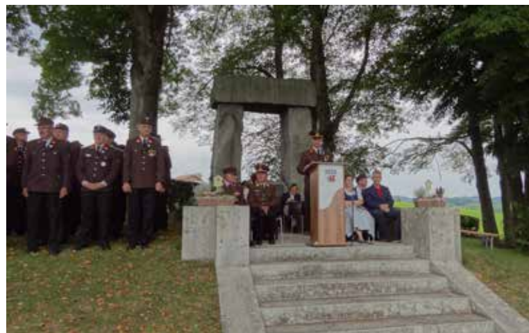
Fahrzeugsegnung FF Pfaffing, Ansprache Kommandant der FF Pfaffing