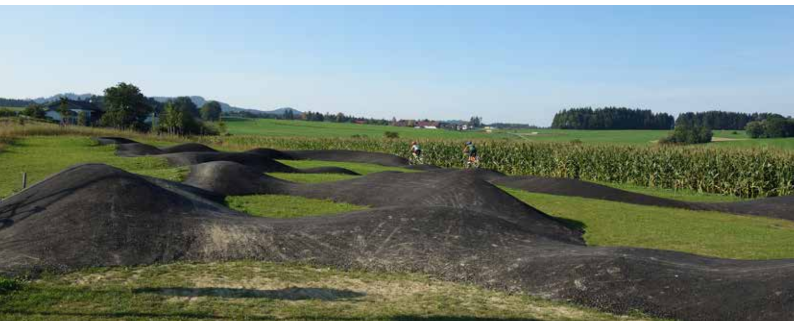
Seit August 2020 ist der neue Pumptrack in Betrieb. Die Freizeitanlage Ziegelhaid befindet sich zwischen Ziegelhaid und Hausham. Bitte beachtet die Benützungssordnung.