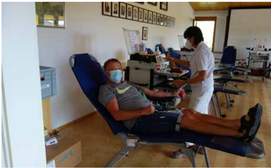
Blutspendeaktion am Donnerstag, 27. August 2020 im Sitzungssaal der Gemeinde Pfaffing.