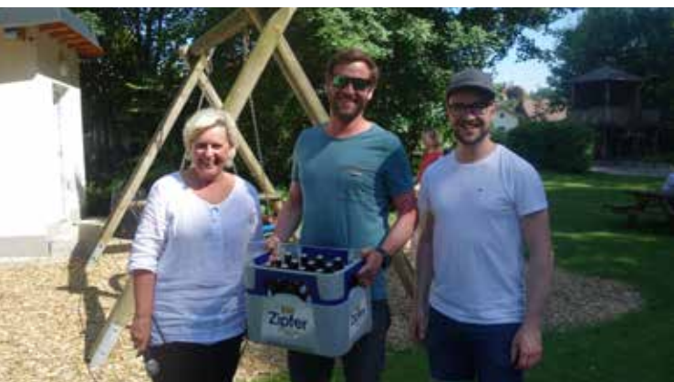
Familienfest am Sonntag, 12. Juni 2022 am Spielplatz in Graben.