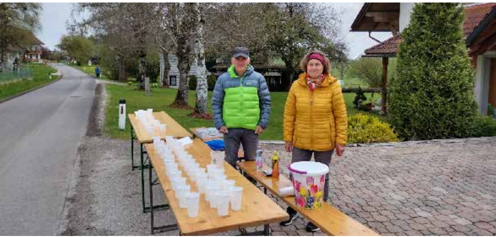
Labstelle in Frieding von der Gemeinde Pfaffing beim Vöcklataler Volkslauf.