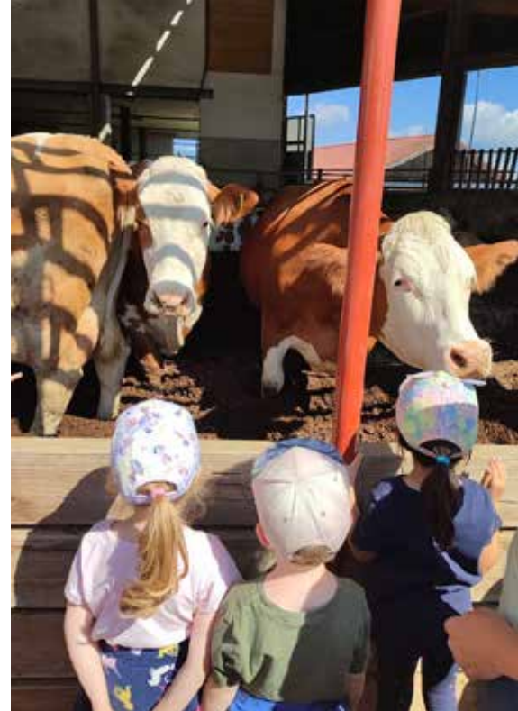
Kindergartenkinder zu Besuch bei den Pfaffinger Bäuerinnen.