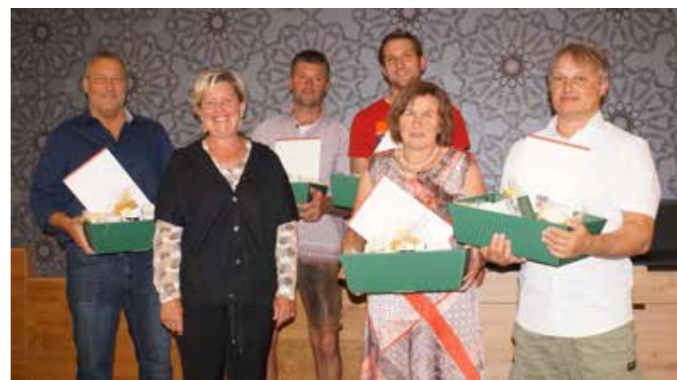
Ehrung ausgeschiedener Gemeinderäte/vorstände am Mittwoch, 15. Juni 2022 im Gasthaus „Die Schmiede“.