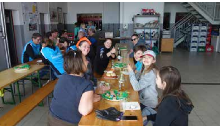
Flurreinigungsaktion „Hui statt Pfui“ in der Gemeinde Pfaffing am Dienstag, 12. April 2022.