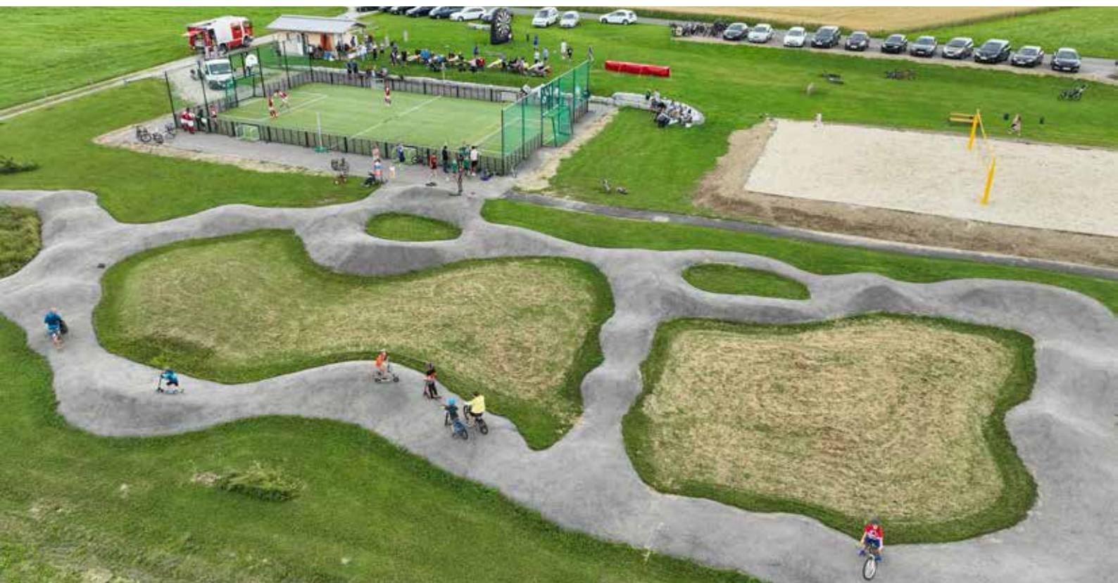
Bei der Funparkeröffnung am Samstag, 9. Juli 2022 wurde ein Fußballkleinfeld-Turnier durchgeführt.