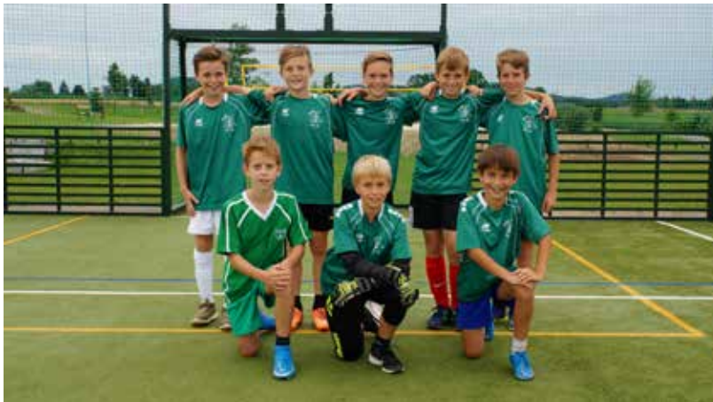
Die jüngsten Teilnehmer beim Fußballkleinfeld-Turnier.