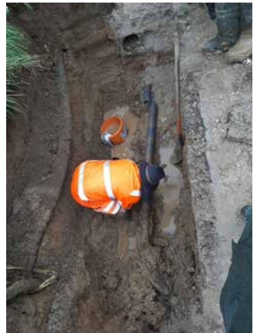
Wasserrohrbruch in Weixlbaumerberg.